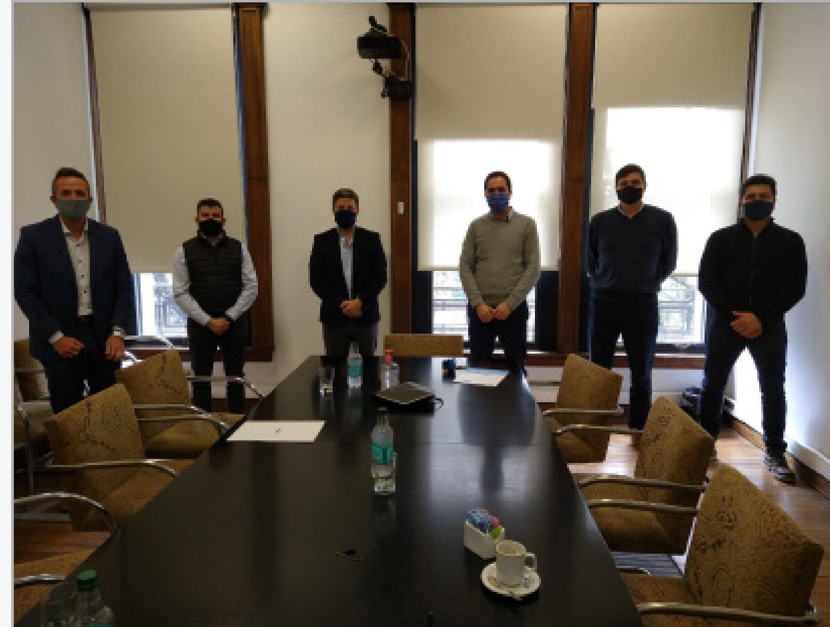
Firma del acuerdo